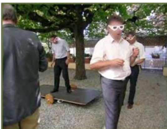
Cours « sol » auprès de l'Inspection fédérale du travail, le 30 septembre.