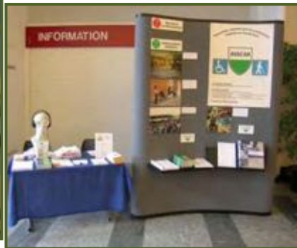
Journée des Communes vaudoises, Palais de Beaulieu, le 20 juin.