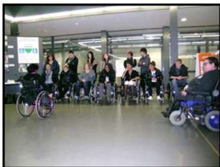
Ici, au Forum du développement durable à Yverdon.