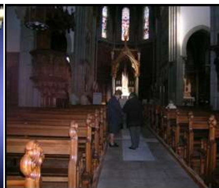
Test de boucle magnétique à l'Eglise Notre Dame à Vevey