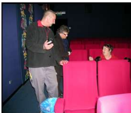
Cinéma d'Aubonne, qui a également deux places pour fauteuil roulant en bout de rangée