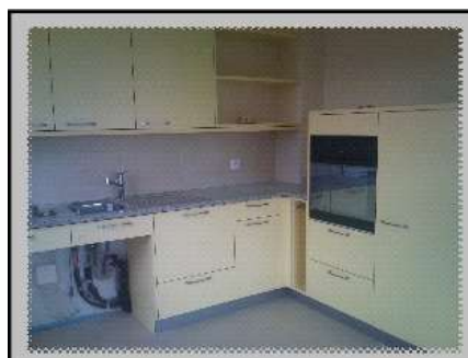
meuble amovible sous le plan de travail,