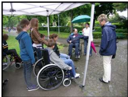
Ici, Bataille des Livres à Lausanne,

Notre remorque de sensibilisation, avec l'appui des membres de notre comité et des groupes régionaux, intéresse vivement le public.