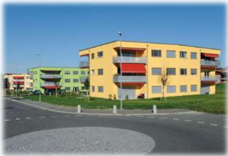
Logements protégés à Echallens,

Au fil des ans, nos interventions et nos conseils portent leurs fruits, p. ex. la piscine de Pully avec un superbe accès au bassin, réalisé dans le cadre d'une rénovation.