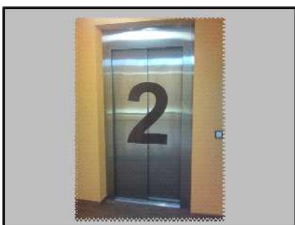
marquage en gros caractère de l'étage sur la porte d'ascenseur,

d'un accès parfait et dans lesquels de nombreux détails ont été pensés pour faciliter la vie des personnes en situation de handicap. Exemples :