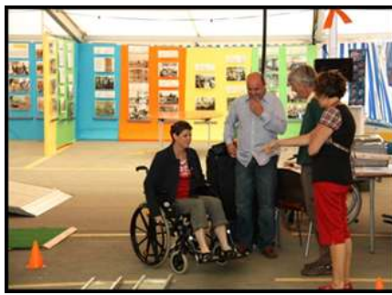
le 50 ème anniversaire du Foyer Ste-Camille à Marly/FR