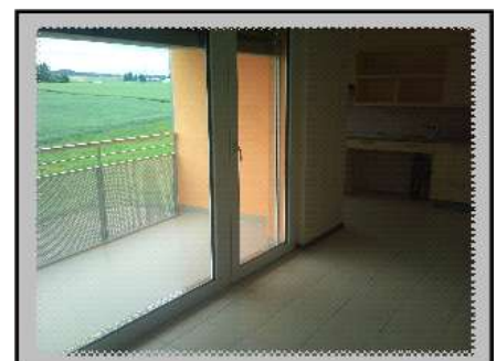
seuils de balcons inférieurs à 25 mm.