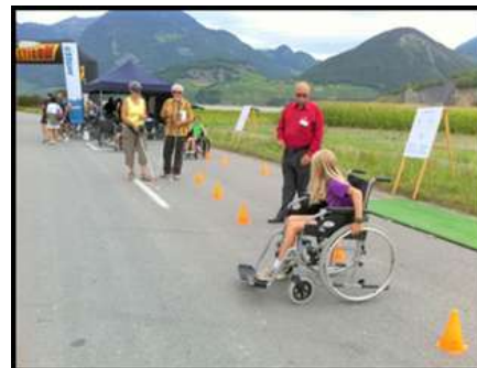
et le Triathlon de la Différence à Ollon.