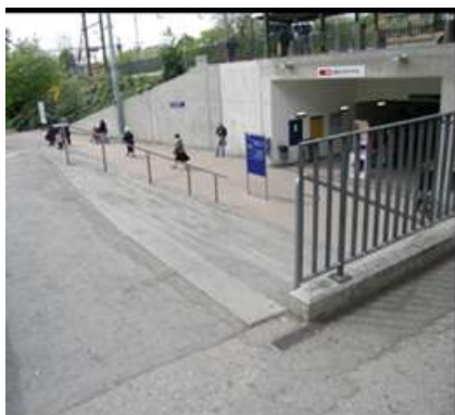
La Gare CFF de Nyon sera adaptée pour les personnes handicapées de la vue.